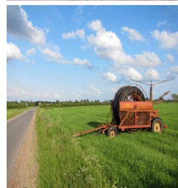
Kort og ruteanvisninger næste side!